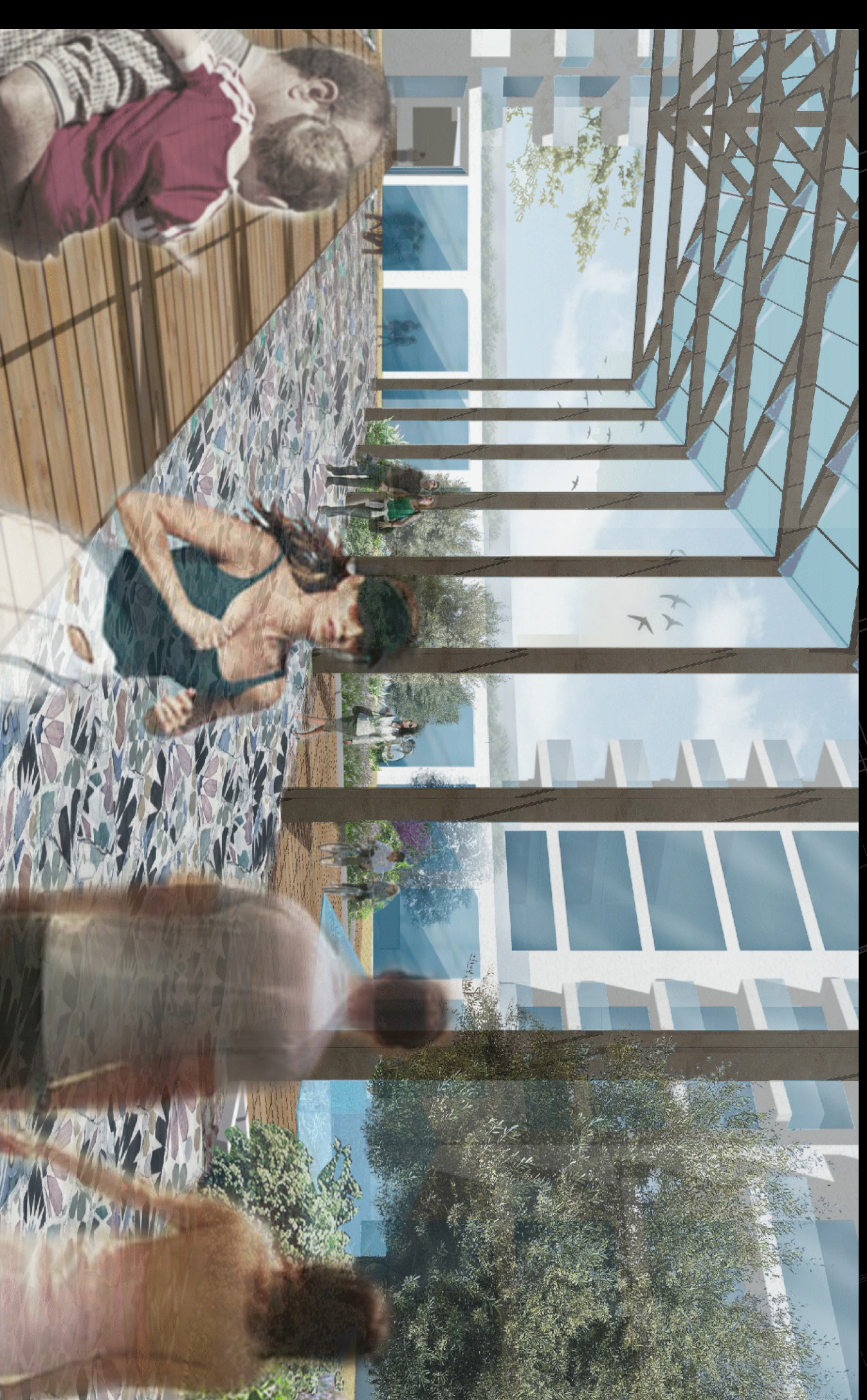
Vista 10 | Visuale da sotto l'area centrale