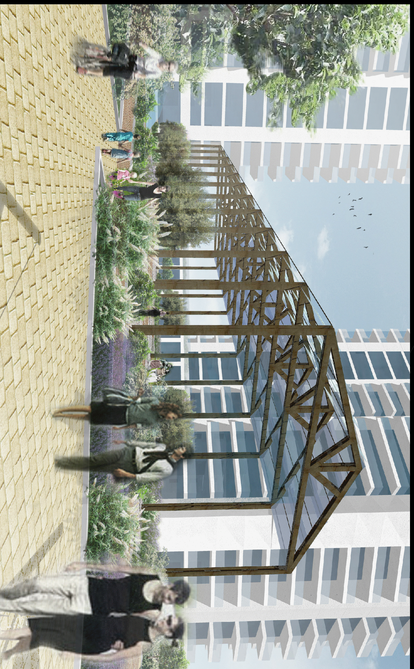
Vista 8 | Visuale dall'area delle vele