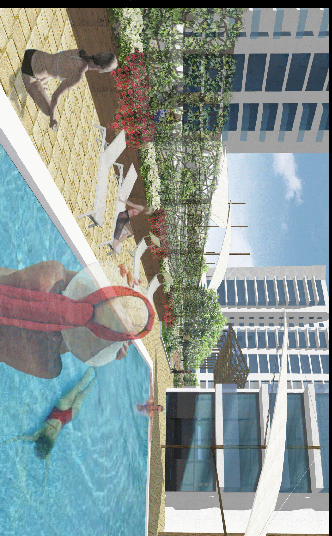
Vista 9 | Visuale della piscina dell'albergo