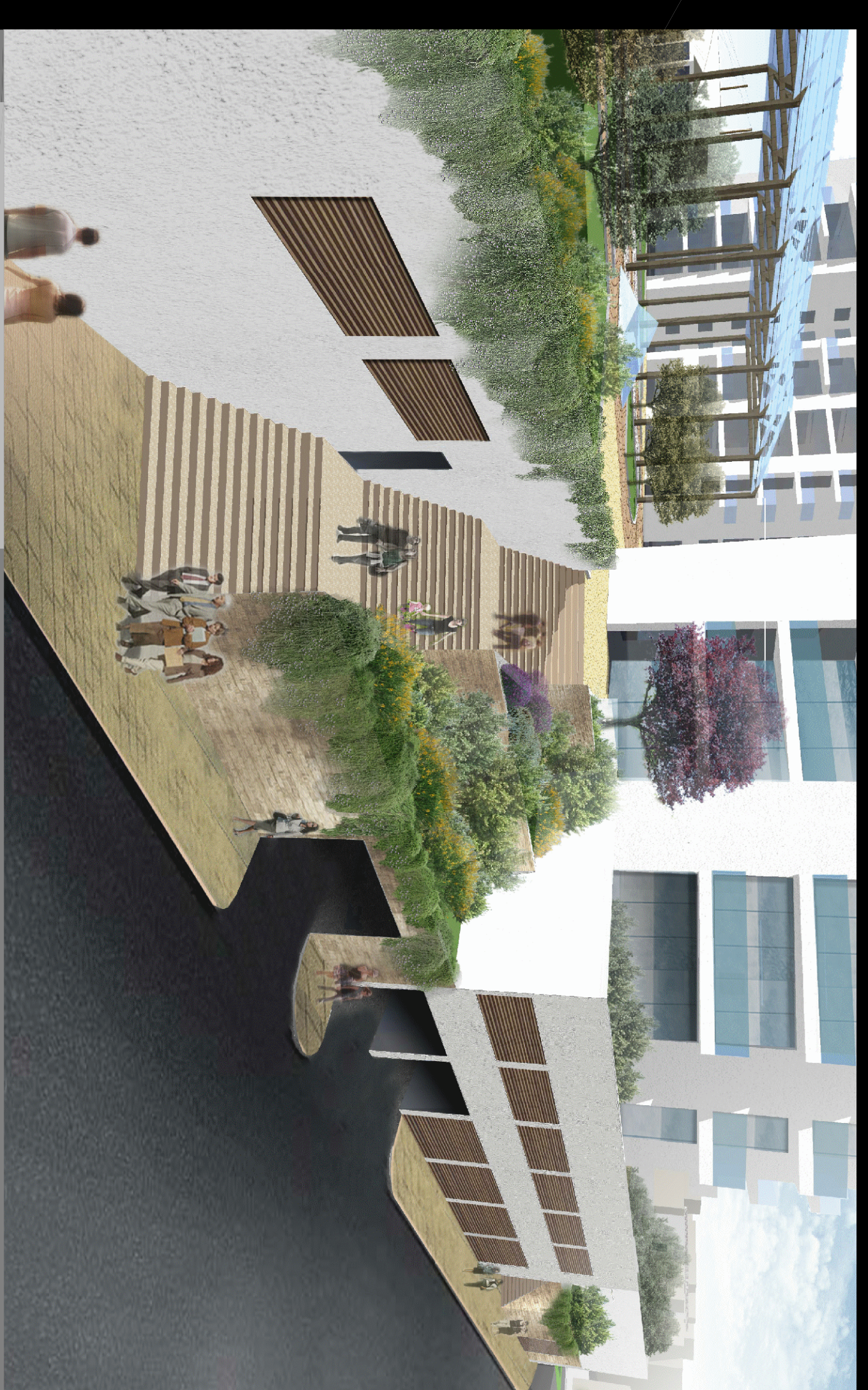
Vista 13 | Visuale della scala di salite alla piazza