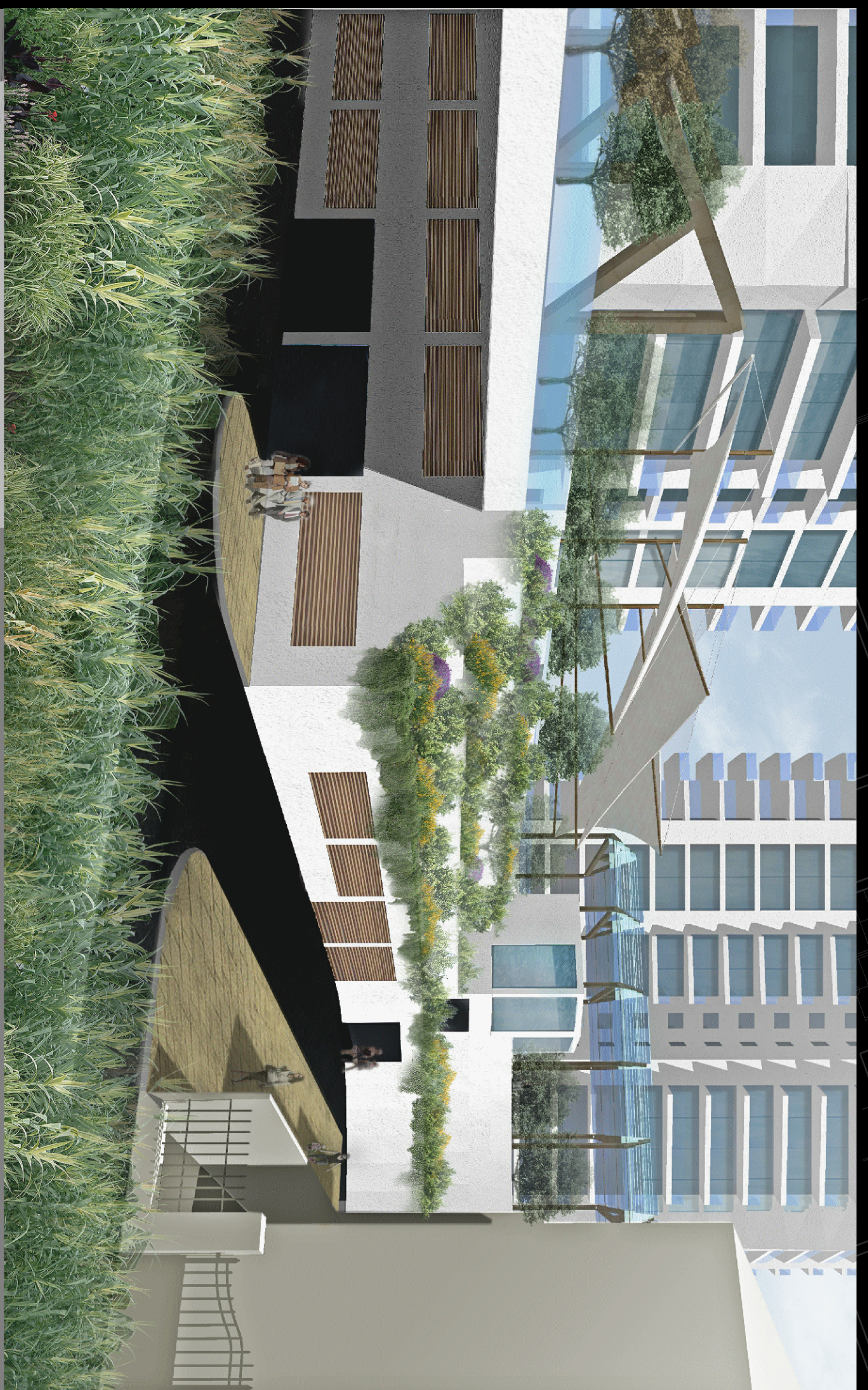
Vista 11 | Visuale da via Casarino