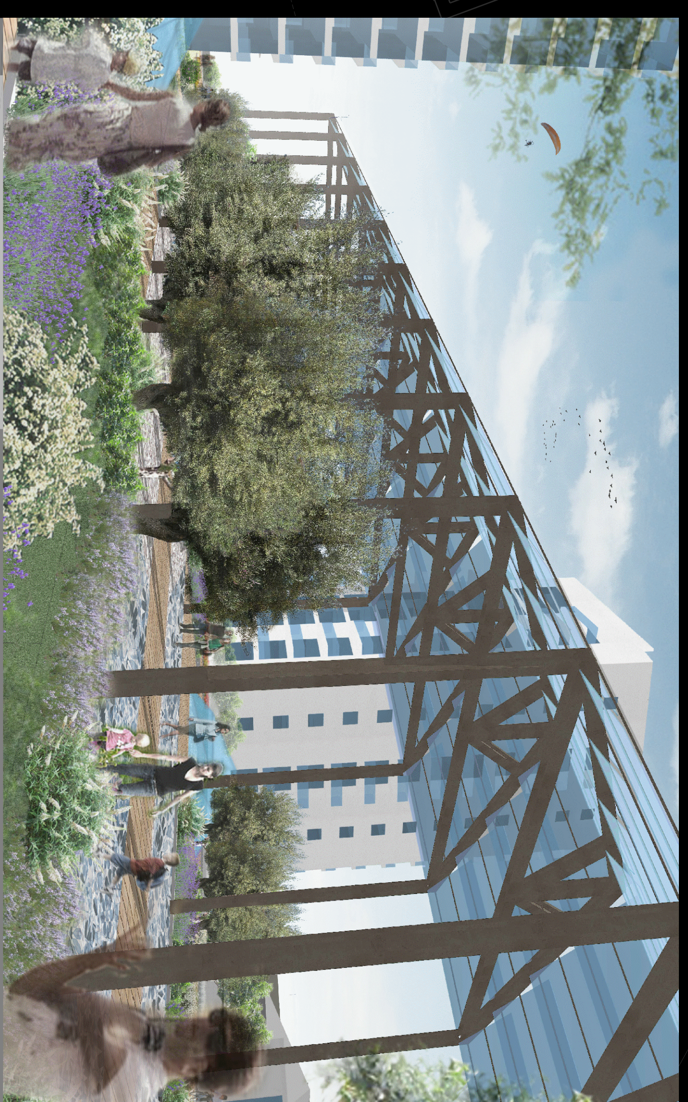
Vista 12 | Visuale dalla piazza