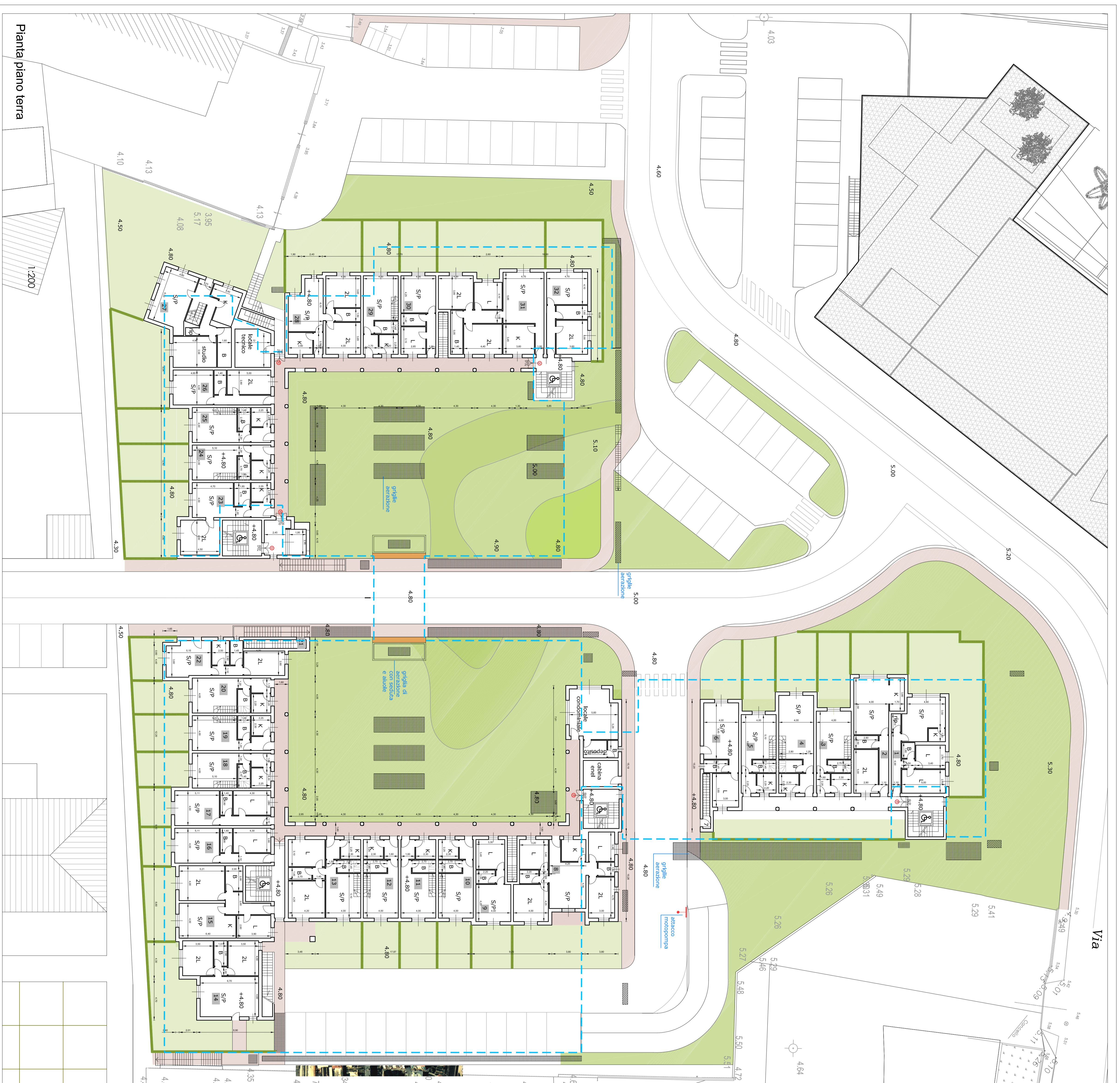
Pianta piano terra