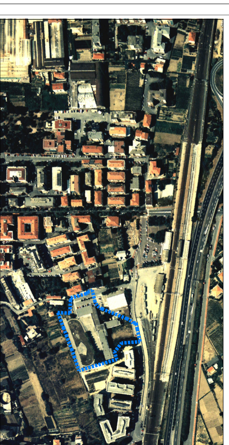
Permesso di Costruire per demolizione e ricostruzione Scuole Via S. Pietro e Bocciodromo (Ambito DTZ del P. R. G. vigente)

Comune di Albisola Superiore PROGETTO PREVENZIONE INCENDI AUTOREMESSA INTERBATA